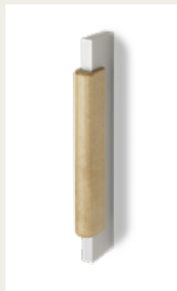
NR. 5 Metallgriff in Silber mit hölzernem Ziehkeil in Eiche, Buche oder Birke.