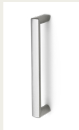
NR. 6 Kunststoffgriff. Silber, Weiß oder Schwarz.