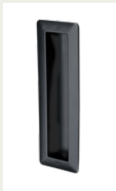
NR. 4 Zurückversetzter Kunststoffgriff. Silber, Weiß oder Schwarz.