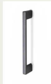
NR. 7 Metallgriff. Silber, Weiß, Schwarz oder Chromfarben.