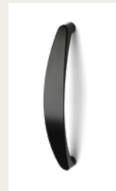
NR. 9 Metallgriff. Silber, Weiß, Schwarz oder Chromfarben.