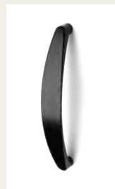
NR. 9 Metallgriff. Silber, Weiß, Schwarz oder Chromfarben.