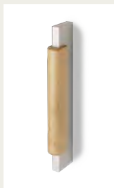
NR. 5 Metallgriff in Silber mit hölzernem Ziehkeil in Eiche, Buche oder Birke.