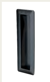
NR. 4 Zurückversetzter Kunststoffgriff. Silber, Weiß oder Schwarz.