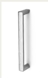
NR. 6 Kunststoffgriff. Silber, Weiß oder Schwarz.