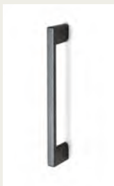
NR. 7 Metallgriff. Silber, Weiß, Schwarz oder Chromfarben.